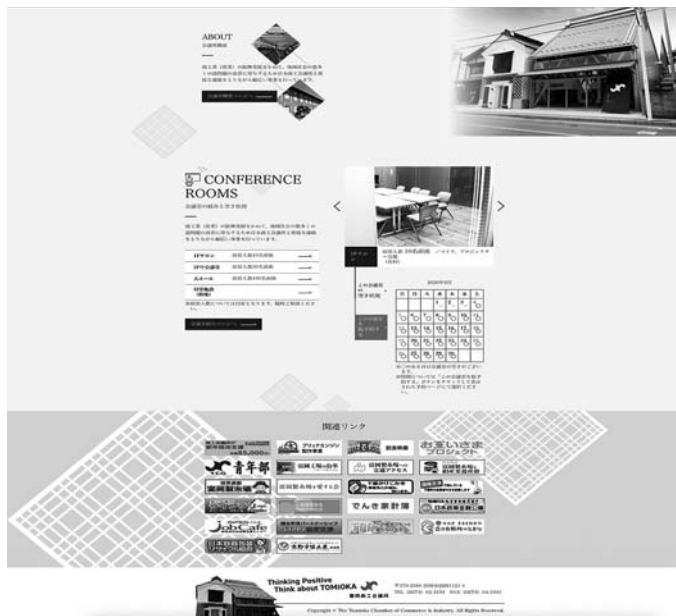
リニューアルされた当所ホームページ