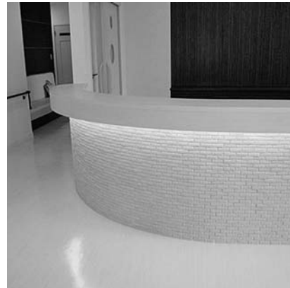
※施工例(某病院受付)